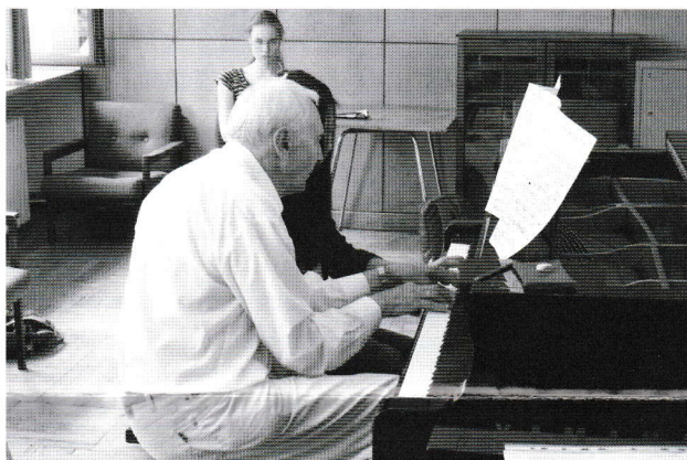
カドゥービスキ教授レッスン